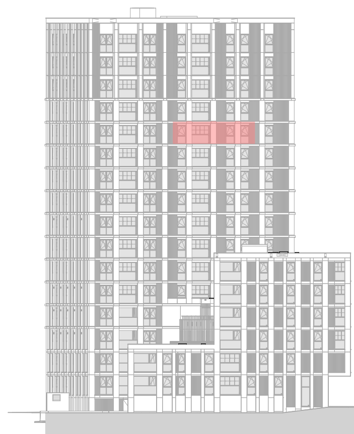
Linker zijgevel 1 : 500