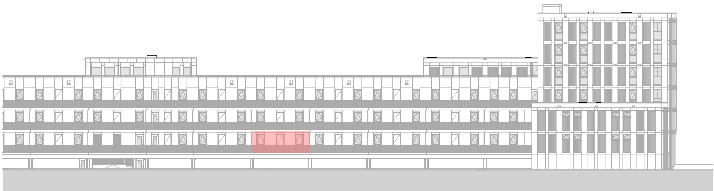
Achtergevel 1 : 500