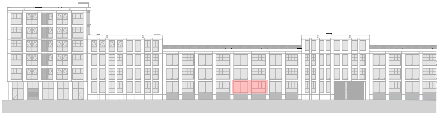
Voorgevel 1 : 500