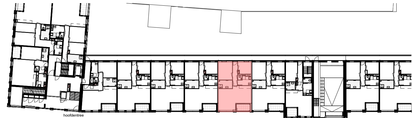
Begane grond 1 : 500